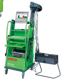
BEA 850 mit Opazimeter RTM 430