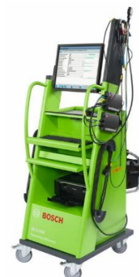
BEA 950 Kombi

Zusätzlich sind im Lieferumfang bei allen vorstehenden Anlagen enthalten: