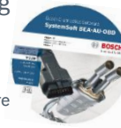
BEA PC-Software LF 5.01

Inhalt: BEA NRS Basis + OBD-Modul KTS 515