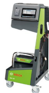
BEA 750 Kombi