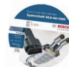
BEA PC-Software LF 5.01

Bestellnummer 1 687 P10 250 999 (BEA PC-SW, DVD) 1 687 P10 252 999 (BEA 750, USB-Stick)