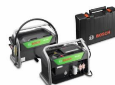
BEA 550 Kombi